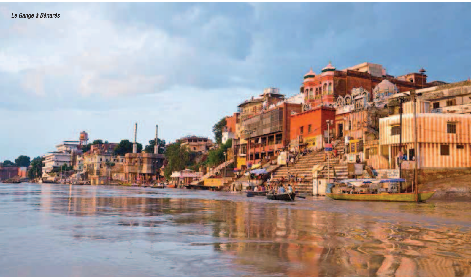
Le Gange à Bénarès