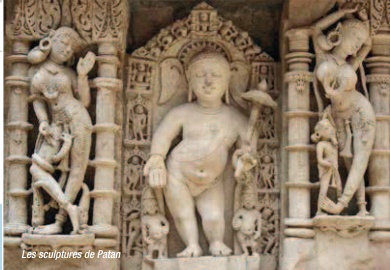
Les sculptures de Patan