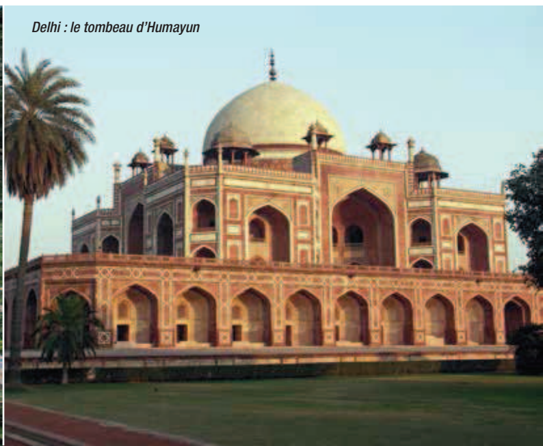
Delhi : le tombeau d'Humayun