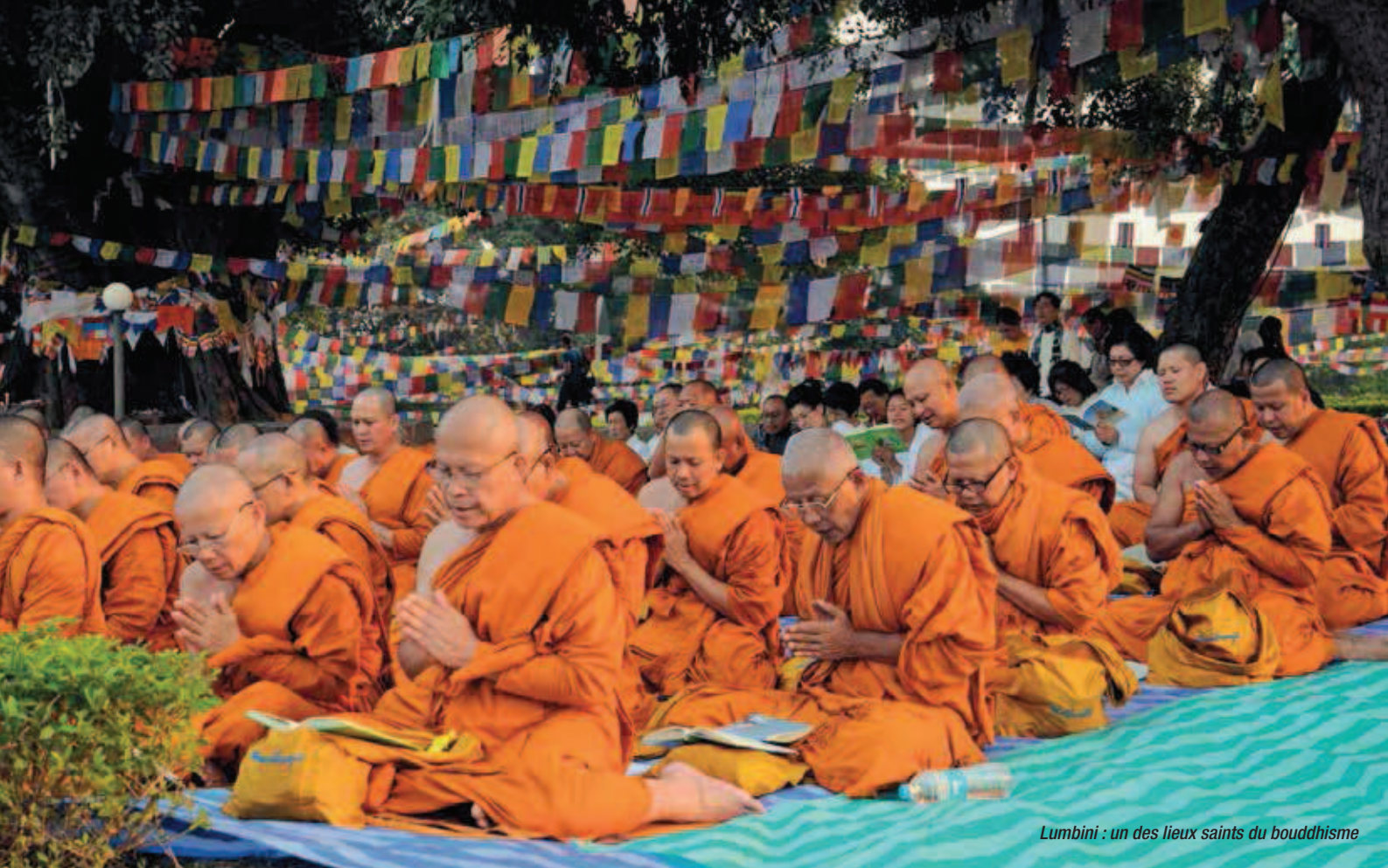
Lumbini : un des lieux saints du bouddhisme